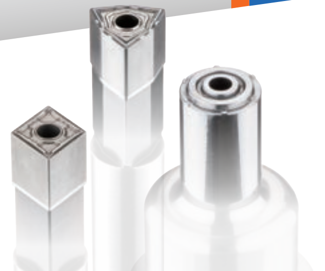
Direct Machining on Tungsten Steel