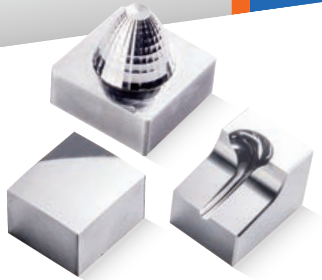
Mirror-Like Surface Machining