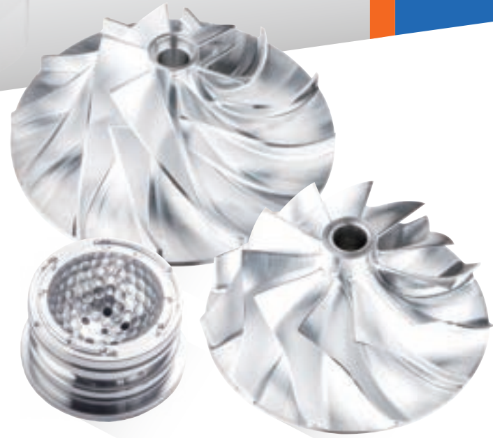
5-Axis Precision Machining