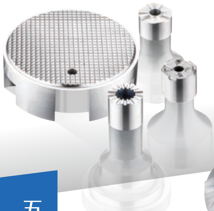
Direct Machining on Pre-hardened Material