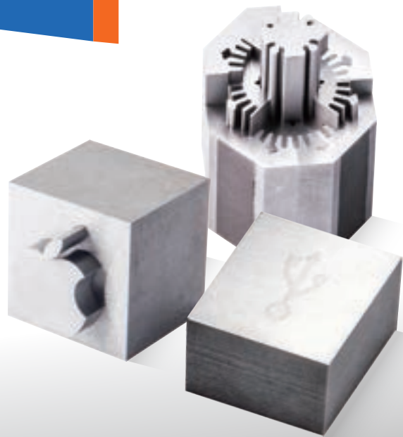
Wire EDM Precision Machining